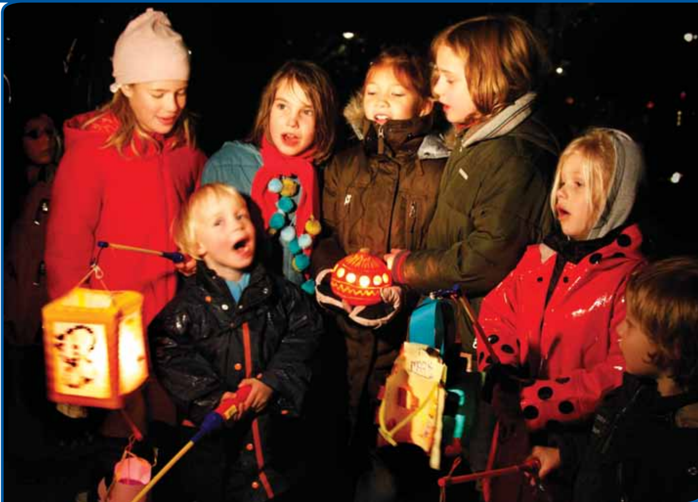
Sint Maarten in Utrecht

Het gaat het Fonds vooral om het leggen van nieuwe verbindingen en actieve cultuurparticipatie. Hier liggen ook mogelijkheden voor volkscultuur en immaterieel erfgoed. Het streven van het fonds is om steeds meer mensen te laten deelnemen aan cultuur en erfgoed. Dat is ook het streven van immaterieel erfgoed organisaties. UNESCO legt erg de nadruk op het levend houden van tradities, op het doorgeven van tradities naar volgende generaties. Om levend erfgoed te kunnen blijven, moet een traditie steeds weer opnieuw van betekenis worden gemaakt voor mensen hier en nu. Als groepen willen dat hun immaterieel erfgoed levend blijft, dan zullen ze contact moeten maken met nieuwe doelgroepen en een actief beleid moeten voeren om meer mensen