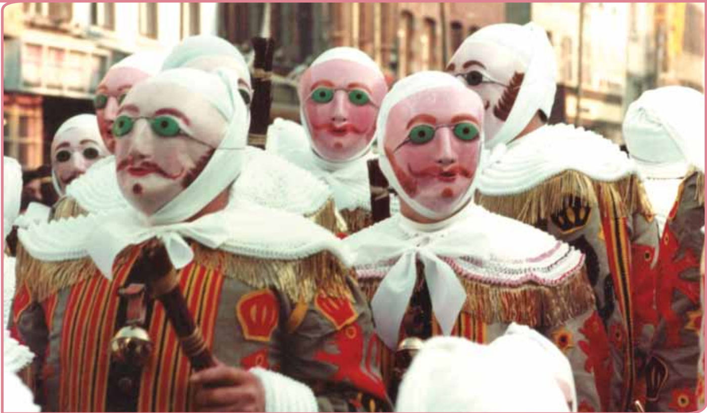
Carnaval in Binche

nu. Deze campagne resulteerde in de breed opgezette bundel Alledaags is niet gewoon. Reflecties over volkscultuur en samenleven . In 2004 werd het volkscultuurbeleid via het Erfgoeddecreet geïntegreerd in het bredere erfgoedbeleid en ging het Vlaams Centrum voor Volkscultuur op in FARO, het Vlaamse steunpunt voor cultureel erfgoed. Dat wil echter niet zeggen dat het begrip volkscultuur werd vervangen door de term immaterieel erfgoed. Beide begrippen blijven in Vlaanderen gebruikt worden, waarbij immaterieel erfgoed (anders dan in Nederland) wordt gezien als de bredere term.