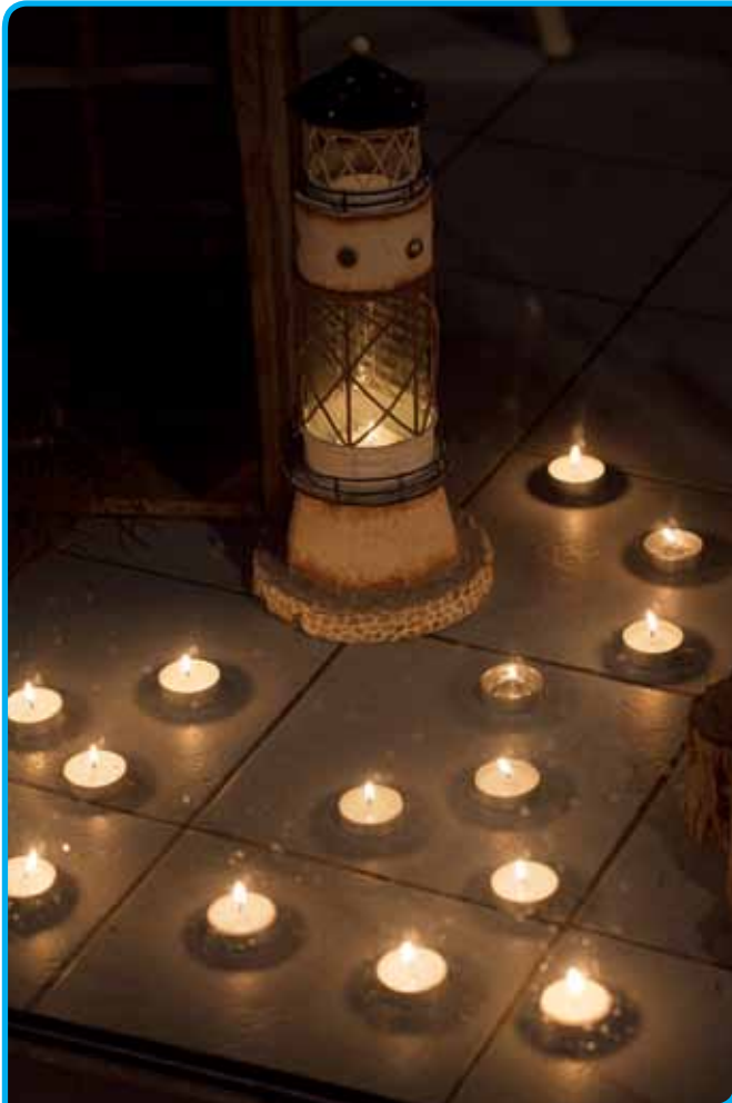
Sint Rochusverlichting in Aarschot