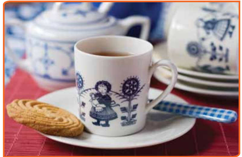
Een koekje bij de koffie of thee als symbool voor de Nederlandse zuinigheid

Dingen die je met plezier doet, daar denk je met genoegen aan terug. Minder leuke dingen, die toch ook verbonden kunnen zijn met tradities, verdringen we misschien het liefst. Bijvoorbeeld de traditie van het thuis opbaren na een overlijden (op 77), waarvan het belang voor mensen wel eens veel groter zou kunnen zijn dan deze lage plaats op de lijst doet vermoeden. Het geldt mogelijk ook voor het bijgeloof (96). Uit ander onderzoek blijkt dat veel mensen bijgelovig zijn, maar daar niet altijd voor uit willen komen.