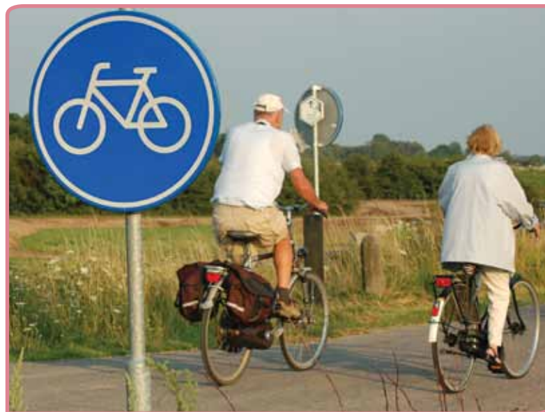
Fietscultuur in Nederland