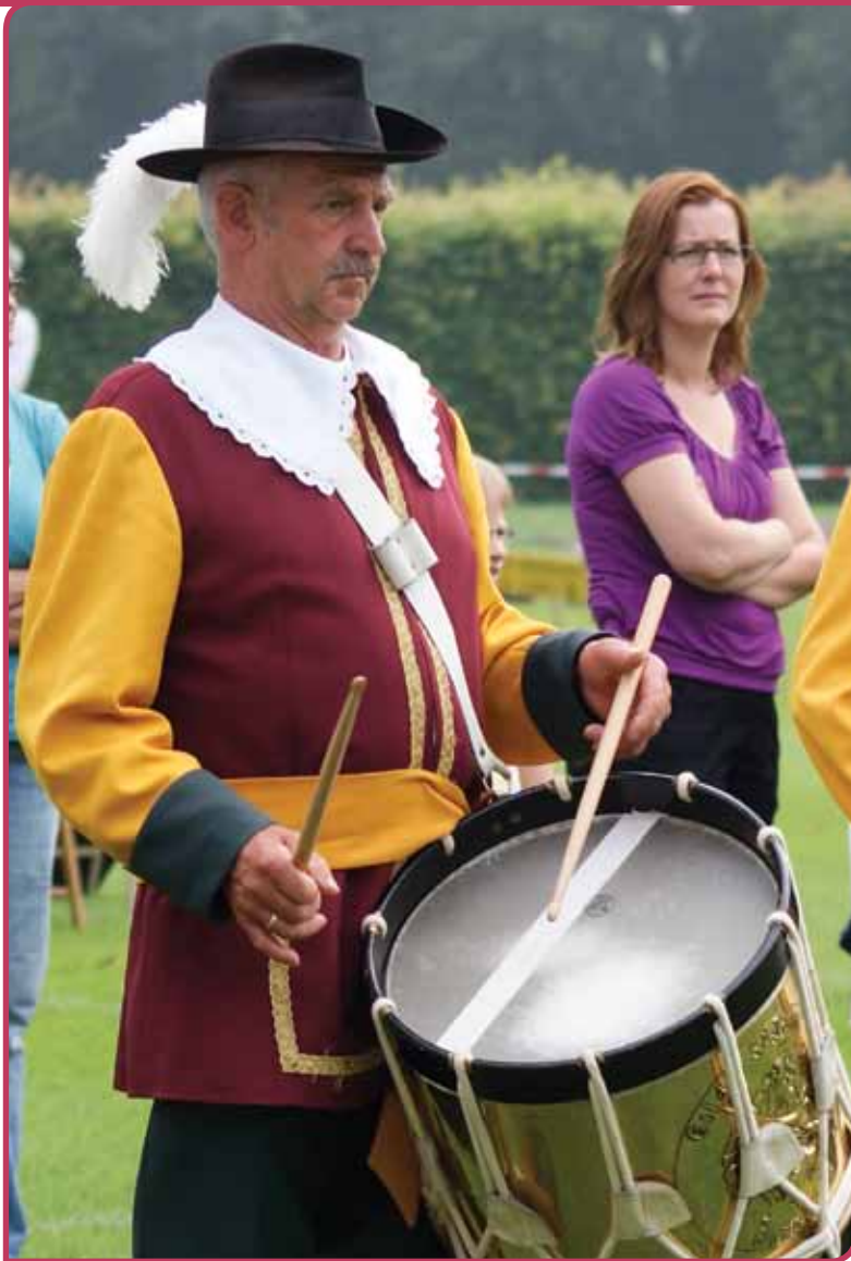
De OLS is grensoverschrijdend

naspelen. In Nederland is de wetgeving op dit punt al aangepast, zodat de levende geschiedenis groepen, letterlijk en figuurlijk, uit de voeten kunnen. Ressen noemt het een probleem dat in verschillende landen heel andere regels gelden, terwijl de activiteiten van de Oud-Limburgse Schuttersfederatie grensoverschrijdend zijn, namelijk afwisselend gehouden worden in Nederlands- en Vlaams-Limburg.