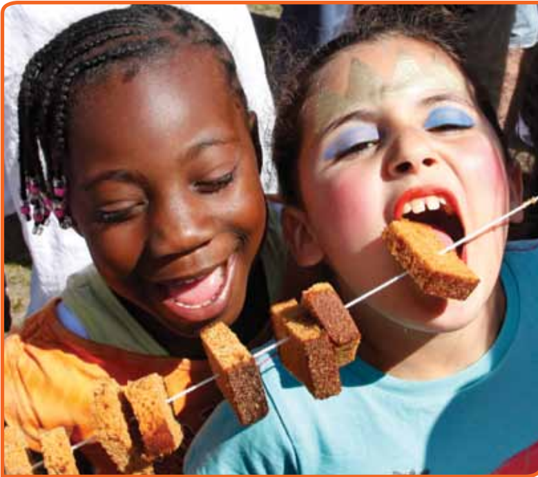
Koekjes op Koninginnedag

in het leven van mensen. Bijvoorbeeld in levenslooprituelen rondom geboorte, huwelijk en dood. Maar ook in religieuze feesten en gebruiken. Nog weer andere tradities roepen dierbare herinneringen op aan de eigen jeugd, zo vielen zaken op als warme chocolademelk drinken (op 91), de eerste communie (98) en Mariabiscuit (94). Nog weer andere zaken worden verbonden met nationale identiteit, zoals bijvoorbeeld het feest van Koninginnedag (op 3),