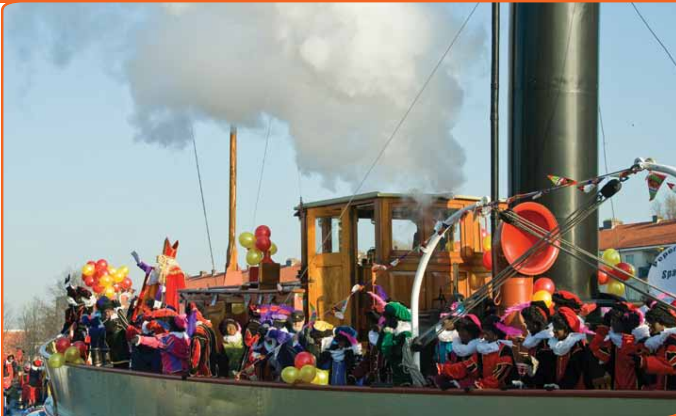
Sinterklaas is uitverkozen tot belangrijkste traditie in Nederland.

den, dan was de uitslag waarschijnlijk heel anders uitgevallen. We vroegen niet naar beelden en zelfbeelden. We vroegen op een heel persoonlijk niveau: 'Wat is voor u belangrijk?'. Zo is voor velen die in Nederland wonen Ketu Koti (op 58) een belangrijke traditie. Dat blijkt uit de uitkomsten van de enquête. Het is een belangrijk feest in Suriname en zal dus vooral door Surinaamse Nederlanders zijn ingevuld. Op een zelfde wijze zullen katholieke Nederlanders gezorgd hebben voor een hoge notering van de Mariaverering (op 61). De lijst van honderd belangrijke tradities is dus een gemiddelde. Het is niet zo dat voor iedere Nederlander al deze honderd tradities belangrijk zijn in deze volgorde. Voor de een is de gewoonte van een biertje drinken (25) belangrijk, terwijl de ander naar de kermis gaan (20) of moederdag vieren (16) als belangrijke, steeds weer terugkerende traditie heeft ingevuld. Zo kun je ook niet zeggen dat de passiespelen in Tegelen (op 84) een belangrijker traditie is dan de traditie van de Limburgse vlaai (85).