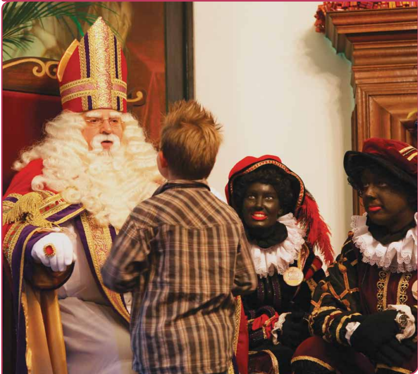
Sinterklaas is immaterieel erfgoed