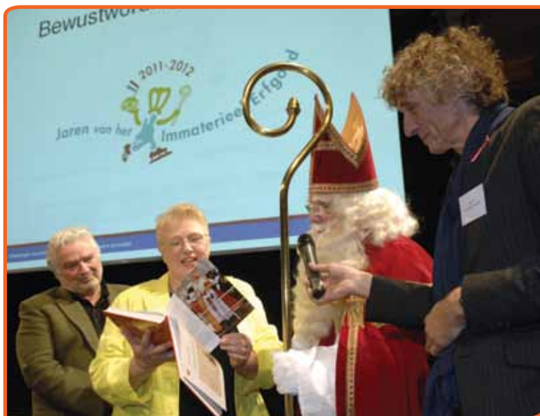
Sint Nicolaas zelf nam het boek Dit zijn wij in ontvangst.

Voor onze enquête hebben we gekozen voor een open vorm. We hebben eenvoudigweg gevraagd: 'Noemt u ons de tien belangrijkste tradities in uw leven'. We hebben niet gevraagd: 'Noemt u ons eens tien typisch Nederlandse tradities'. Als we dat gevraagd had-