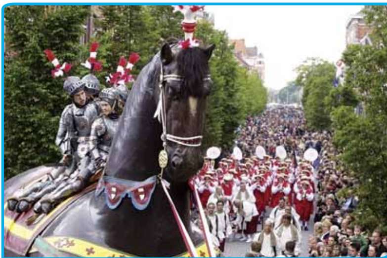
Ros Beiaardomvang in Dendermonde

Met al die zaken in het achterhoofd, komt men in Vlaanderen met de volgende definitie van immaterieel erfgoed. Immaterieel erfgoed is: