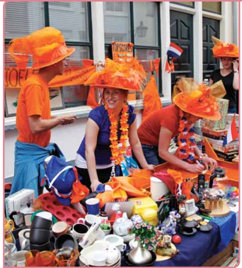
Koninginnedag in Utrecht

Ze maakte dit onderscheid duidelijk door te verwijzen naar het onderzoek van het Nederlands Centrum voor Volkscultuur naar wat Nederlanders belangrijke tradities vinden. Op deze lijst staan gebruiken met een geschiedenis, die ook op een immaterieel