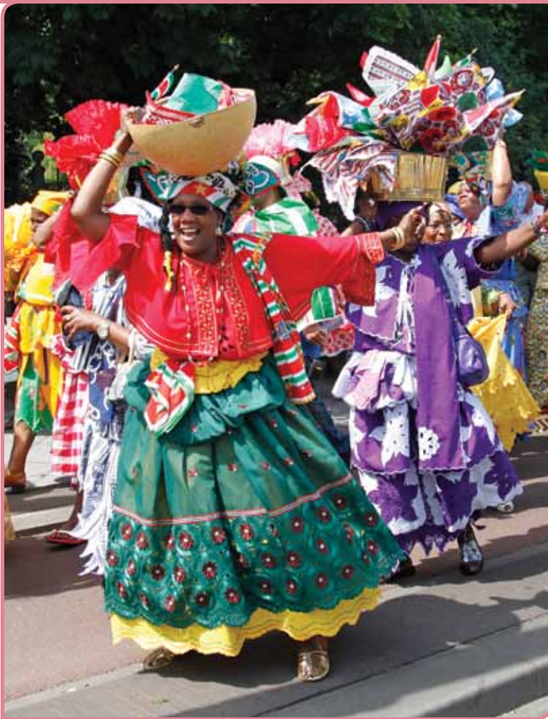
Keti Koti in Amsterdam

verenigingen vragen om mee te helpen met het schrijven van de historische achtergrondverhalen. Het wil organisaties stimuleren aan de slag te gaan en op die manier de participatie aan immaterieel erfgoed vergroten.