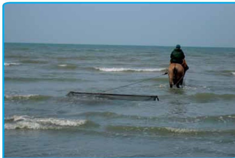
Garnalenvisserij in Oostduinkerke