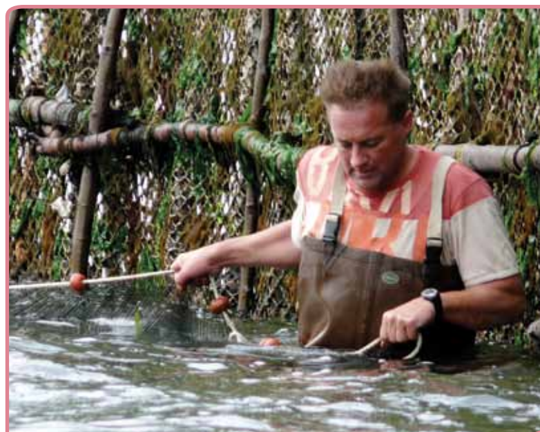
Anisjovis vissen in Bergen op Zoom