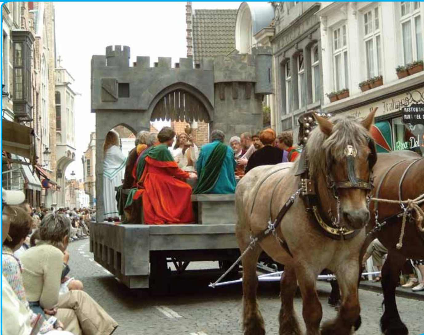
Heilige Bloedprocessie in Brugge

plaats te geven binnen het Vlaamse erfgoedbeleid in het algemeen. Op dit moment is men bij het Agentschap bezig met het ontwikkelen van een visienota, waarover al gesproken is met verschillende partners in het veld, waaronder FARO, Tapis Plein en Volkskunde Vlaanderen. Daarbij is het zaak om de internationale tekst van UNESCO een Vlaamse vertaling te geven, die ook aansluit bij het Vlaamse erfgoedbeleid meer in den brede. Punten die aan bod komen zijn bijvoorbeeld: wat is de relatie met roerend en onroerend erfgoed? Hoe verhoudt het begrip immaterieel erfgoed