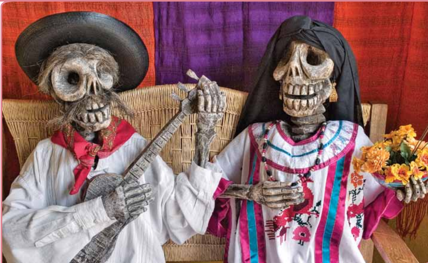
Dodendag in Mexico